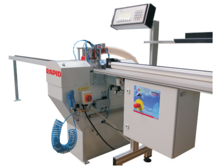
Abb./fig. 3: GLX Holz mit Posi-Basic/ GLX Holz with Posi-Basic

RAPID-Maschinenbau GmbH -Vertrieb- D-72415 Grosseffingen · Balingen Str. 29