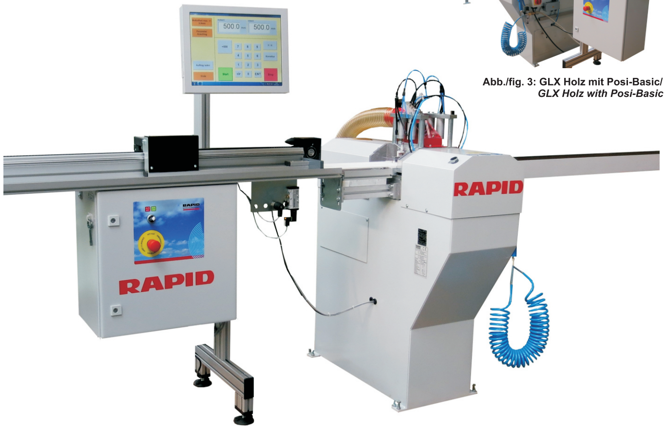
Abb./fig. 2: GLX Holz mit Posi-Touch/ GLX Holz with Posi-Touch